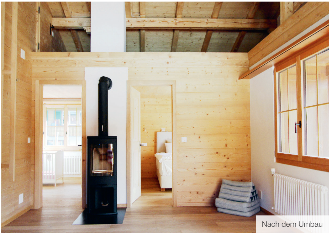
Nach dem Umbau